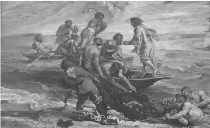
Peter Paul Rubens (1577–1640), Der Wunderbare Fischfang (1618/19)

D er niederländische Maler Rubens hat vor 400 Jahren ins Bild gesetzt, wie dramatisch die Situation damals am See Gennesaret gewesen ist. Eine echte Herausforderung für die Jünger: Wider alle Vernunft werfen sie noch einmal die Netze aus. Und fangen so viel, dass es ihnen nicht nur die Netze, sondern beinahe auch den Verstand zerreißt. Das sind die Momente, in denen man auf die Knie fällt und ruft: Mein Herr, mein Gott. Momente der Überwältigung. Gott gelingt etwas, was für unmöglich gehalten wurde. Menschen kennen diese Momente: überwältigt von der Liebe; überwältigt von der Schöpfung; überwältigt von einem Glück, das, genau betrachtet, reine Gnade ist. Da muss man mit dem Herzen auf die Knie. Dann gibt es nur noch eins: Danke sagen.