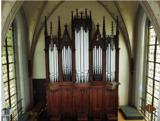
Bildunterschrift: Prospekt der historischen Ritter-Organ (1856) in Düffelward